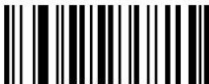
Obnoviti privzete nastavitve