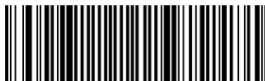
DODAJ ETX NAZAJ